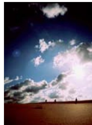
Fra Albert Serras El cant dels ocells .